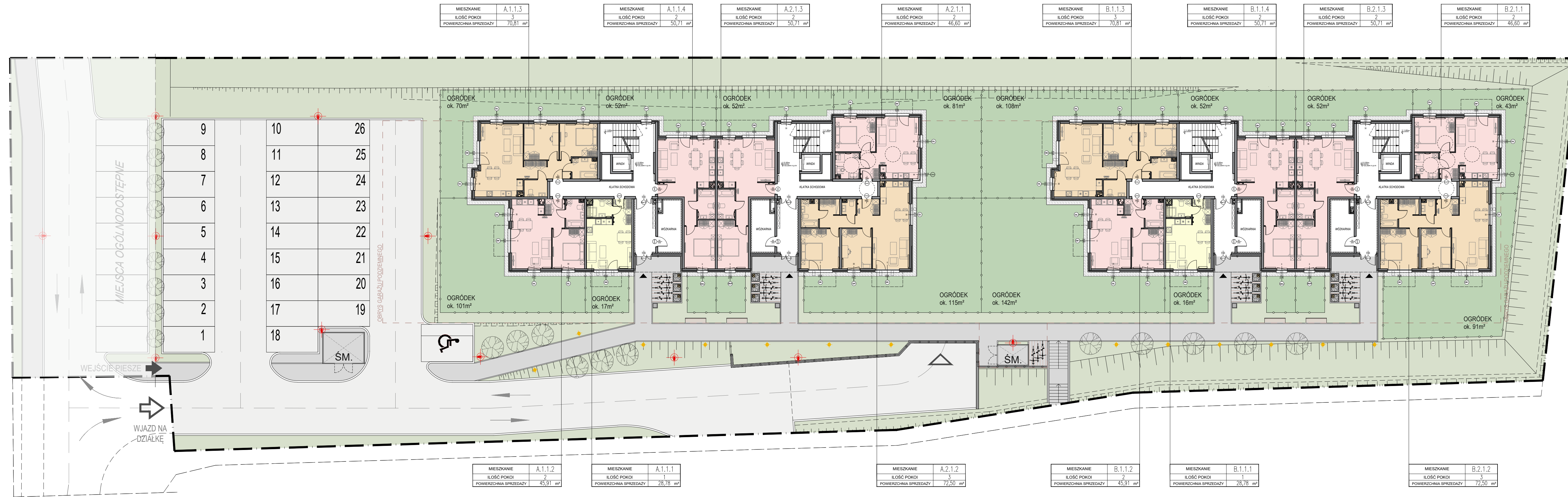
STOLARKA OKIENNA I DRZWIOWA: